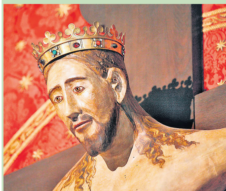
Kreuz in Hülfsenberg

Gebet des heiligen Franziskus nach Ubertin von Casale