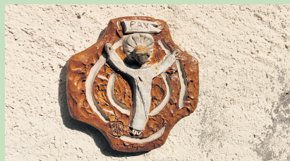
15. Station des Kreuzweges im Klostersgarten Näfels